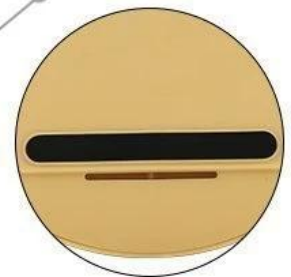
Bottom non-slip mat