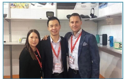
2018.09 Germany IFA Fair