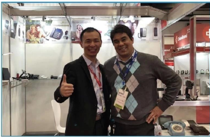
2019.07 Brazil Eletrolar Show