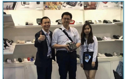
2019.04 HK Electronics Fair