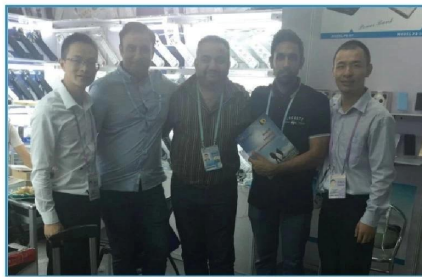
2017.10 Guang Dong Canton Fair