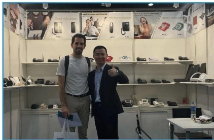
2023.10 HK Electronics Fair