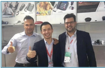
2017.09 Germany IFA Fair