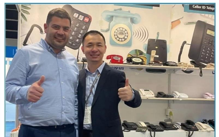
2024.04 HK Electronics Fair