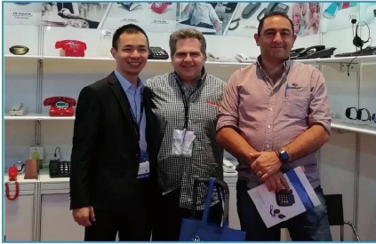
2018.10 HK Electronics Fair