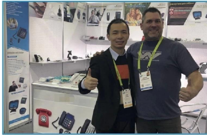
2019.01 USA CES Show