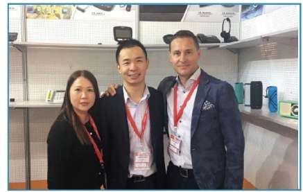
2018.09 Germany IFA Fair