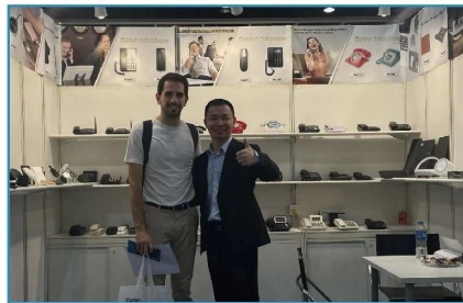
2023.10 HK Electronics Fair