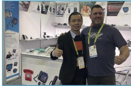
2019.01 USA CES Show