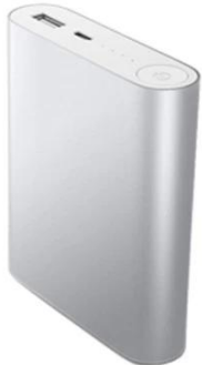
Bluetooth Speaker Wireless Charger Phone Holder Power Bank